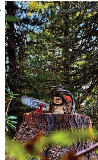
PRODUIT: #000005 CATÉGORIE: TRAVAUX FORESTIERS