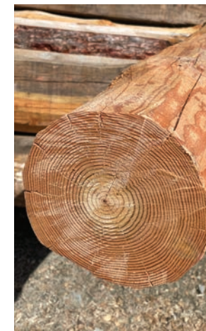
PRODUIT: #BILLON CATÉGORIE: PRODUITS FORESTIERS