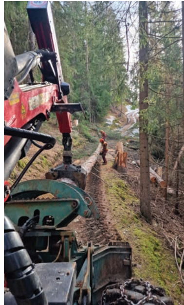
PRODUIT: #000005 CATÉGORIE: TRAVAUX FORESTIERS

Notre engagement au cœur de la nature se traduit par des interventions respectueuses et ciblées, au service de la forêt et de sa biodiversité. Du débardage de bois à l'abattage sélectif pour favoriser le rajeunissement forestier, en passant par l'entretien des forêts protectrices et les actions concrètes en faveur de certaines espèces, chaque geste vise à préserver l'équilibre fragile de nos écosystèmes tout en assurant la sécurité et la pérennité de nos espaces boisés.