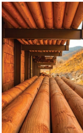
PRODUIT: #PERCHE CATÉGORIE: PRODUITS FORESTIERS