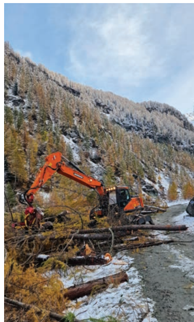
PRODUIT: #000005 CATÉGORIE: TRAVAUX FORESTIERS