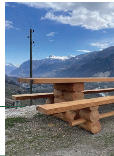
Table fabriquée en bois brut ou troncs débités, conçue pour s'intégrer naturellement dans les espaces et offrir un mobilier rustique et durable.

PRODUIT: #BANC CATÉGORIE: TRAVAUX POUR TIERS