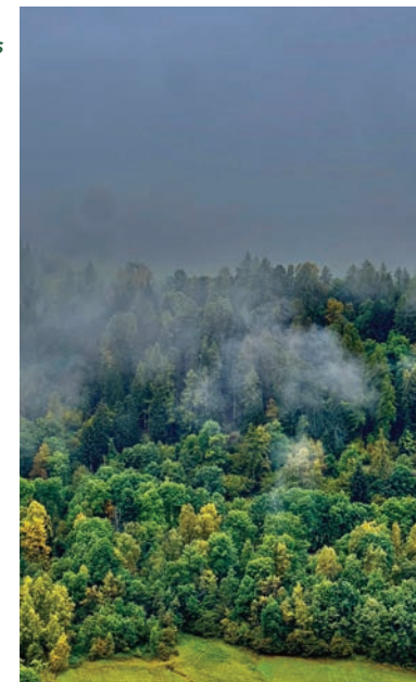
PRODUIT: #000005 CATÉGORIE: TRAVAUX FORESTIERS