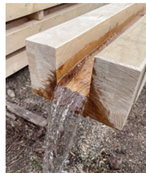
PRODUIT: #RENVOIEAU CATÉGORIE: PRODUITS FORESTIERS