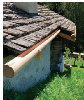
PRODUIT: #CHENEAU CATÉGORIE: PRODUITS FORESTIERS